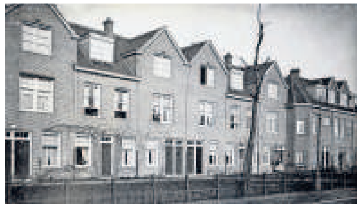
→ De Meeuwenlaan, gebouwd in 1915.

D e goedkope en slecht uitgevoerde revolutiebouw door particulieren rond 1900 baart het gemeentebestuur grote zorgen, zeker als in De Pijp nieuwbouwwoningen instorten. Met de oprichting van de gemeentelijke dienst Bouw- en Woningtoezicht, op 27 maart 1901, neemt Amsterdam landelijk het voortouw tegen speculanten. De directeur, ingenieur J.W.C. Tellegen, vaardigt een bouwverordening uit en laat vele krotwoningen onbewoonbaar verklaren en slopen.