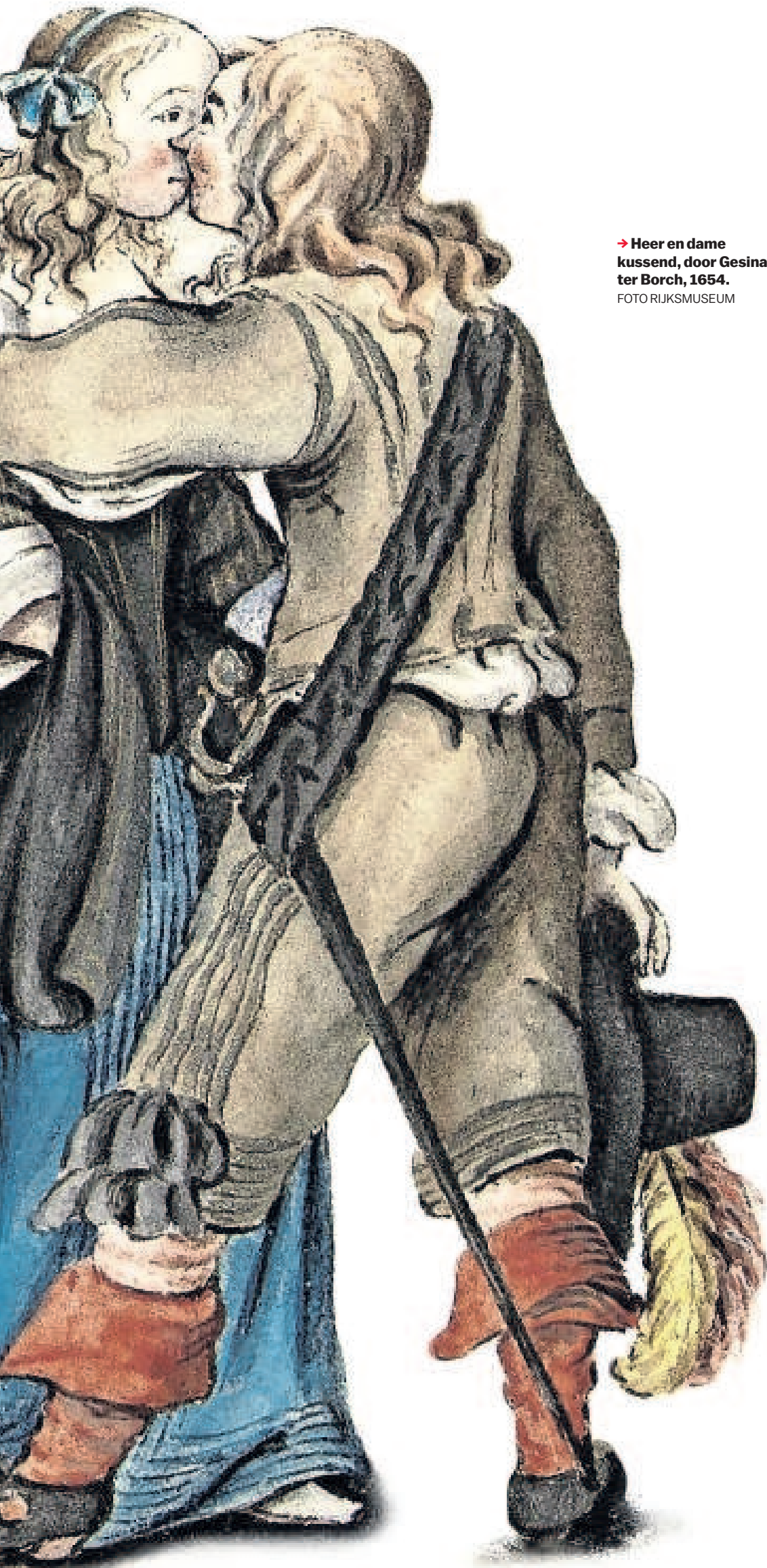
→ Heer en dame kussend, door Gesina ter Borch, 1654.